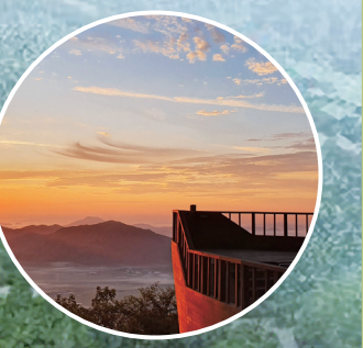
주월산 정상 (패러글라이딩 활공장)

※ 이 안내도는 2022년 8월 8일 기준으로 구성했습니다. ※ 계절과 날씨, 조성공사 등으로 방문하시는 때에 따라 실제 구성이나 위치가 안내도와 다를 수 있습니다.